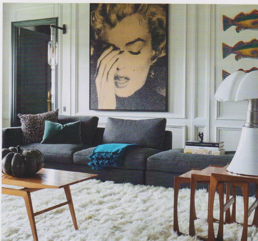
Un tapis épais et tout doux donne de la chaleur à l'association du bois verni et du métal laqué de la célèbre lampe Pipistrello. Tapis Toison, à partir de 1 207 €. Toulemonde Bochart.

Jouant avec les reliefs et les volumes, les textures dynamisent les ambiances et subliment les effets de style.