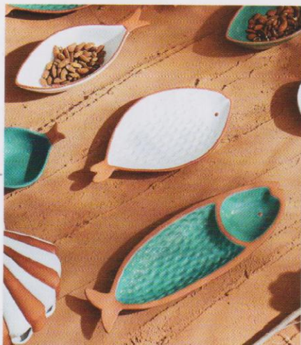
Terre cuite brute et émaillée : un seul matériau, deux effets de texture. 2 plats Aquatic, 74,90 €. Côté Table.

Ces textures très diverses se rejoignent pourtant sur un point : toutes apportent du relief au décor grâce à la sensation de volume et aux contrastes qu'ils créent. C'est cette aptitude animer les ambiances, à engendrer une sensation de mouvement, de dynamisme, de chaleur et de vie que l'on recherche donc en jouant avec les textures, par opposition aux ambiances plates, monotones, fades et uniformes voire froides, qui résultent de l'absence d'effets texturés. On sait bien par exemple que l'apport d'un textile, sous quelque forme que ce soit, coussins, plaids, rideaux ou tapis, adoucit l'ambiance d'une pièce. Ou que les veinures d'un parquet, la présence de poutres en bois ou d'un mur en bardage bois réchauffent l'atmosphère. Ou encore qu'un élément en inox apporte de la modernité à une cuisine classique ou campagne. Un constat qui, outre l'effet général d'animation qu'apportent les textures, amène à parler de la nécessité de faire les bons choix selon l'ambiance que l'on veut créer.