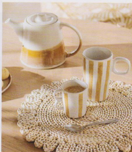
La porcelaine prend ses quartiers d'été sur un dessous de plat tressé façon dentelle. Théière Madaba, 26,99 €. Maisons du Monde.