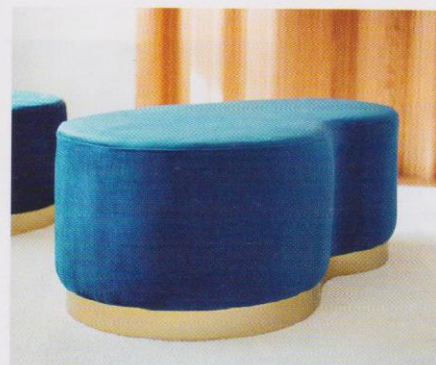
Textile et métal dans un duo lisse et tout doux. Pouf haricot deux places Dallas, 495 €. Produit Intérieur Brut.

Jouant avec les reliefs et les volumes, les textures dynamisent les ambiances et subliment les effets de style.