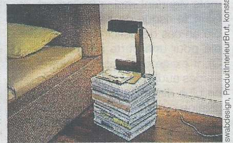
swabdesign, ProduitinterieurBrut, konstantinlawinski

Un nouveau chevet est l'occasion de faire un bon tri pour ne garder que l'essentiel.